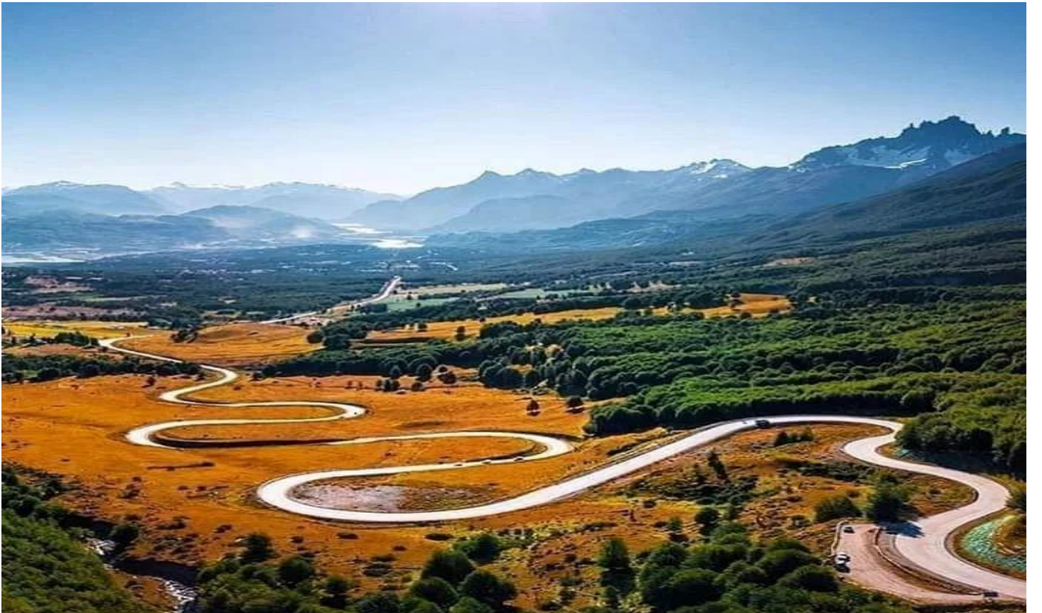
Cuesta del Diablo, en el corazón de la Carretera Austral.