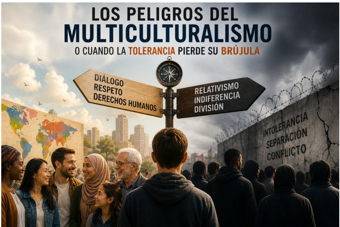
Imagen creada por ChatGPT