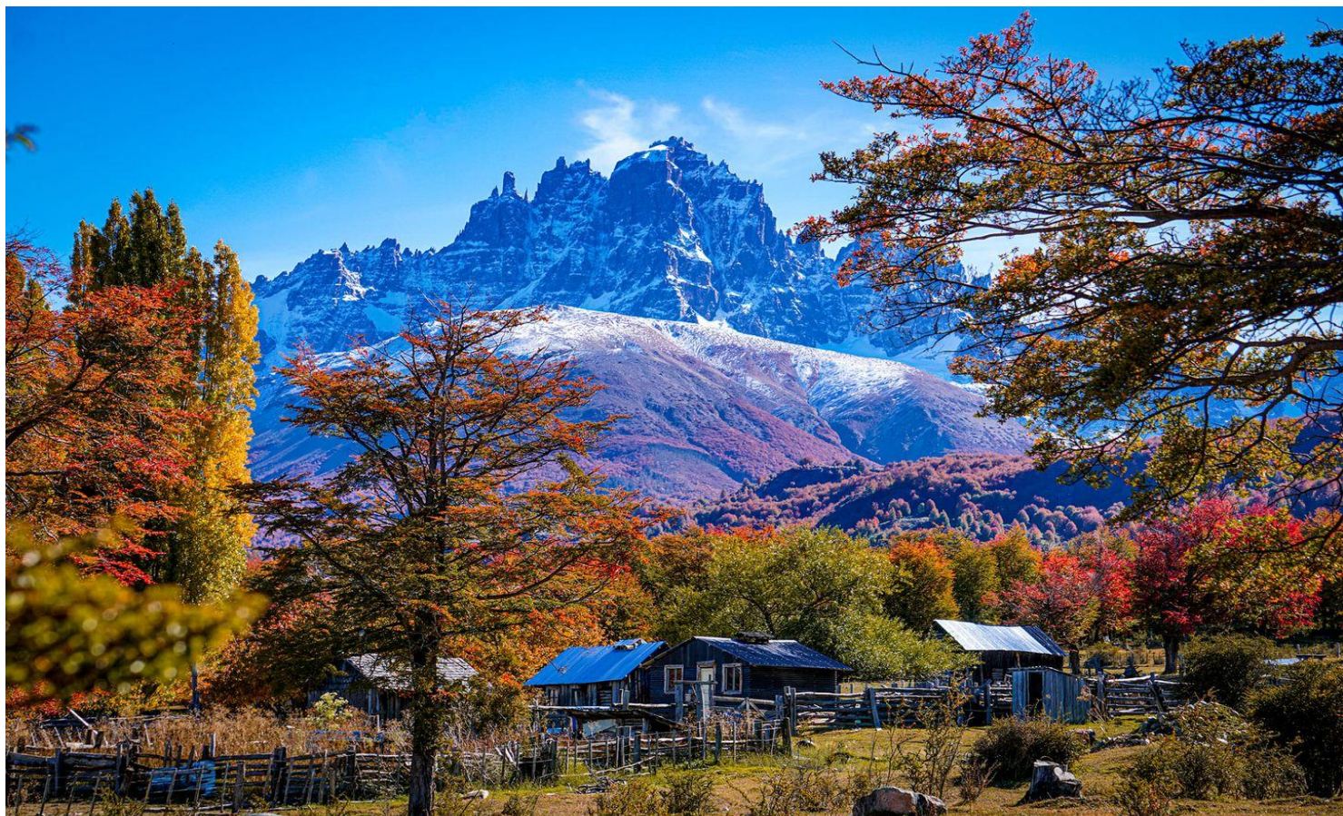
Paisaje otoñal en Cerro Castillo, carretera austral