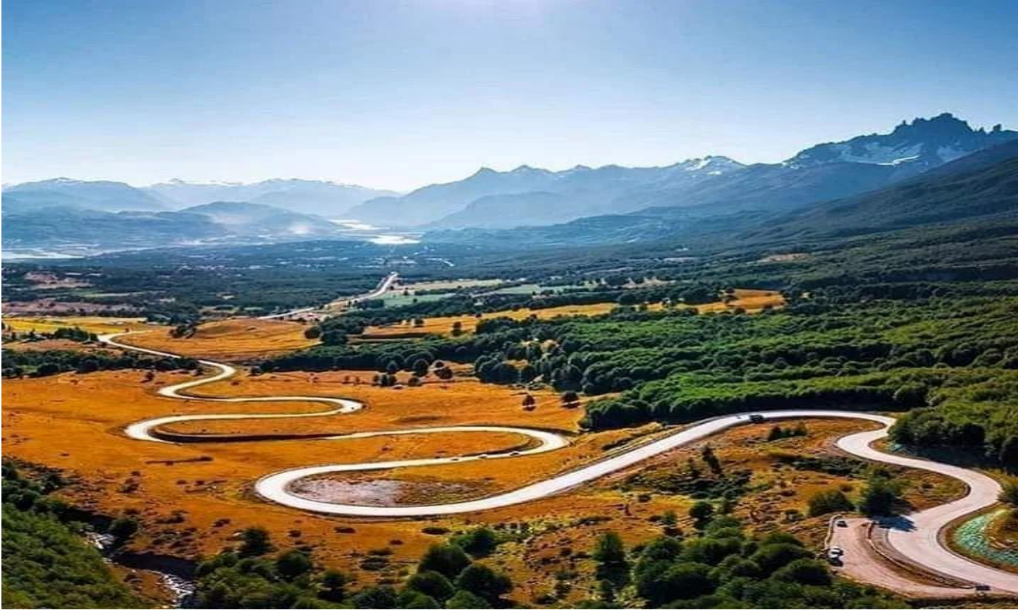
Cuesta del Diablo, en el corazón de la Carretera Austral.