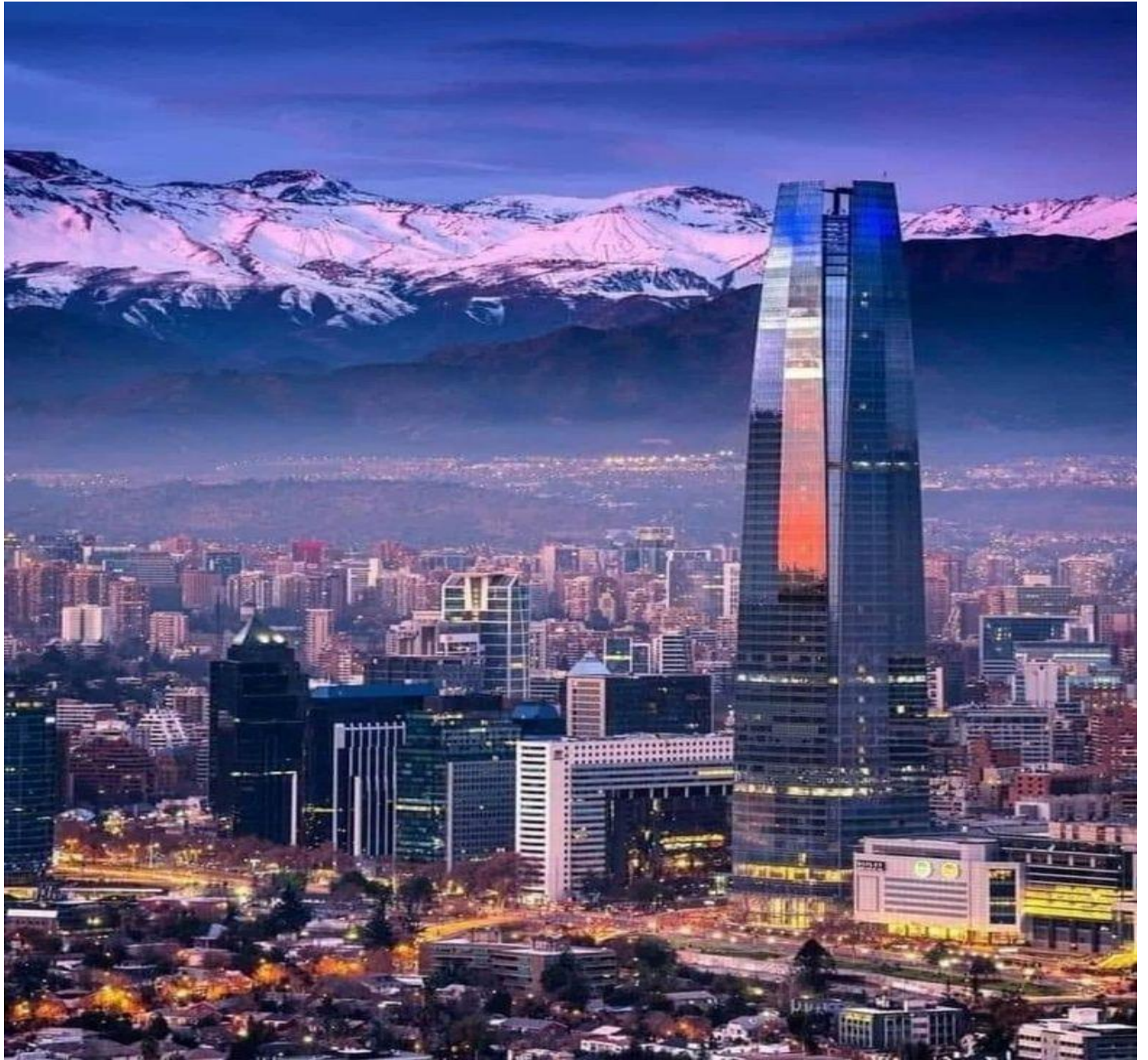
Anochecer en Santiago de Chile, Chile. 🇨🇱 B.P.G.