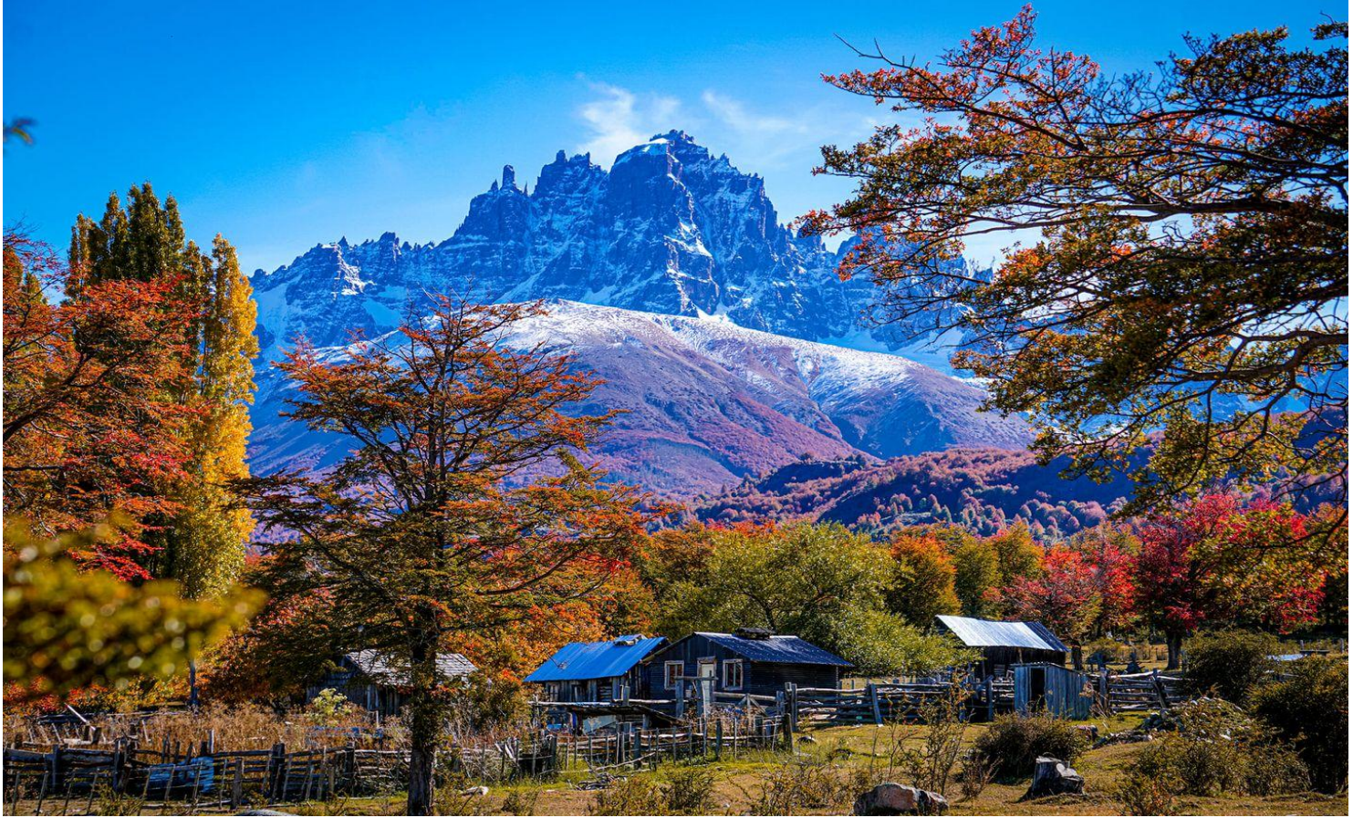
Paisaje otoñal en Cerro Castillo, carretera austral